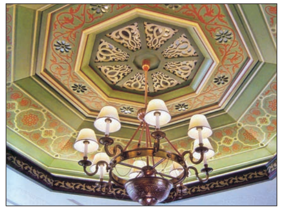
L'hôtel Mövenpick à Beyrouth, 2002. Exécution du mobilier et des luminaires chapeautés par un plafond octogonal orné de motifs et de coloris dans un style orientaliste.